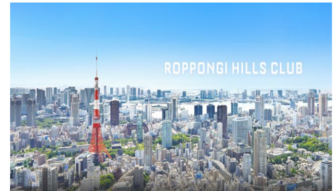
Tokyo Landscape from the Roppongi Hills Club, Japan