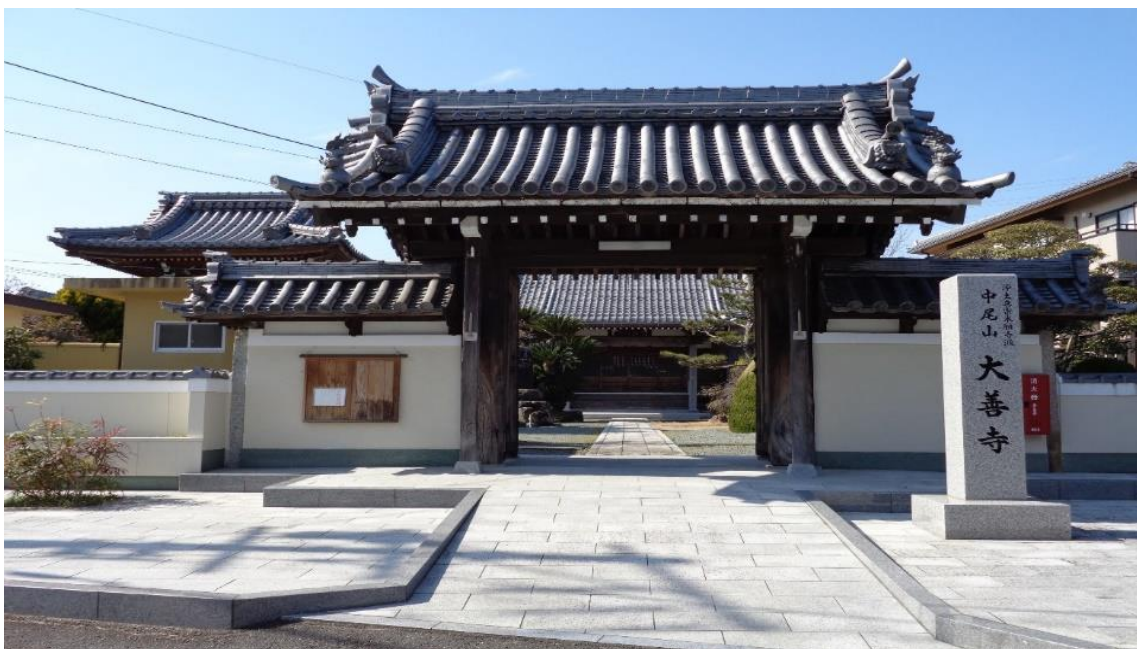
「死人に口なし」大善寺