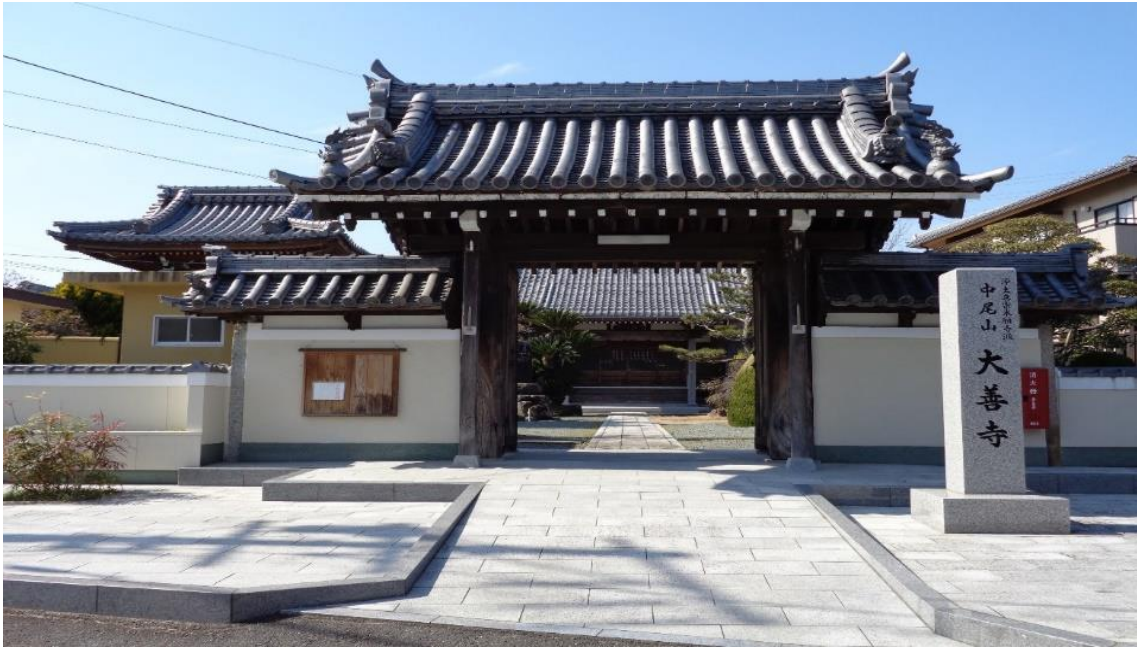
“The dead can’t speak” Daizenji Temple (Tsu City, Mie Prefecture, Japan)