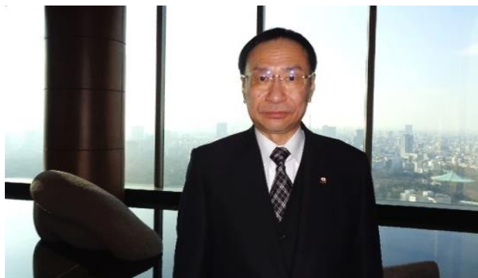
60th Birthday (January 26, 2022)

また、元最高裁判所判事的那須弘平弁護士を委員長とする、那須弘平弁護士を含む計 7 名の弁護士と 1 名の医師により構成される「学校法人東京医科大学第三者委員会」によって作成された「第三者委員会調査報告書（最終報告書）、公表版」（日本語原文）は、読破させていただくと本文 14 Page 上から 17 行目「・・・ いずれも不合格となった」の文末句読点「。」が欠落しています。この点につきましては、那須弘平弁護士によられます、1) 誤植の確認漏れに伴う間違い、2) 何らかの意図があり、故意に脱落とされた、のいずれかが考えられました。元最高裁判所判事（裁判官）的那須弘平弁護士（国立東京大学法学士）を委員長とする、那須弘平弁護士を含む計 7 名の弁護士と 1 名の医師により構成される学校法人東京医科大学第三者委員会によって作成された 2018 年 12 月 28 日付「第三者委員会調査報告書（最終報告書）」の信憑性及び学校法人東京医科大学第三者委員会及び最高裁判所への信頼、信用が、このことにより大きく揺らぐ訳ではありませんが震度 1 程度の軽い揺らぎは感じられ、日本の三権分立、立法（国会）、行政（内閣）、司法（裁判所）のうち立法及び行政が関与してみえる大学の裏口金権入試について、司法が付度された可能性も否定出来ません。繰り返しになりますが、裏口入学として 6 千万円以上出され、自らが裏口金権私立大学の医学士（医師）となってみえる岸田文雄 現総理大臣に近い広島県出身の自民党国会議員もいらっしやいまして、またお顔が少なからず赤くなってしまう程恥ずかしい不正入試並びに不適切入試について計 5 編の調査報告書を出された私立東京医大自体は、世界に知られた震度 7 の激震です。